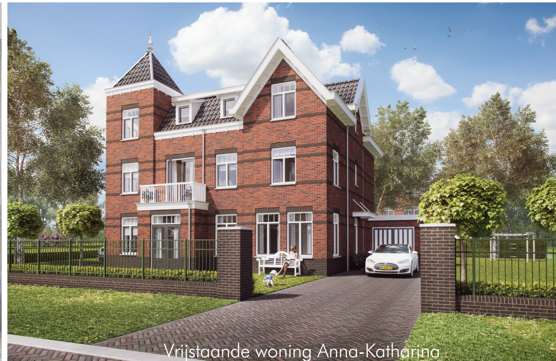
Vrijstaande woning Anna-Katharina Het Vroongoed Den Haag

Voor meer informatie www.vroondaal.nl of: